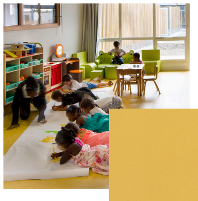
Sand Yellow Artikel-Nr.: MP-SY1206/0606