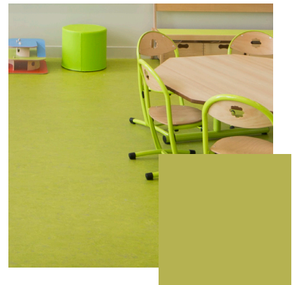
Grass Green Artikel-Nr.: MP-GG1206/0606

Eine hochwertige Beschichtung sorgt dafür, dass die Oberfläche eine hohe Kratzfestigkeit aufweist. Ein UV-Schutz auf natürlicher Basis garantiert hohe Lichtechtheit. Die ruhige Textur des Bodenbelags schafft ein harmonisches Flächenbild mit subtilen Nuancen. Wie bei allen echten Naturprodukten variiert jede Platte leicht in ihrer Farbe und Struktur, bleibt aber gesamtflächig dennoch sehr harmonisch. MINERO Playflor ist in drei verschiedenen, naturnahen Farbtönen ab Lager lieferbar. Individuelle Sonderfarben sind ab 500 m 2 pro Auftrag möglich.