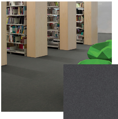
Olive Black Artikel-Nr.: MP-OB1206/0606

Durch den Einsatz hochwertiger und widerstandsfähiger Rohmaterialien, eines patentierten und durchdachten Verlegesystems, sowie der extrem robusten Nutzschicht ist es möglich, diesen Bodenbelag am Ende seines Lebenszyklus zerstörungsfrei rückzubauen, zu überarbeiten und dann wieder in einen weiteren Lebenszyklus einzuspeisen. Wiederverwenden statt wegwerfen - das ist Nachhaltigkeit in ihrer ursprünglichen Bedeutung.